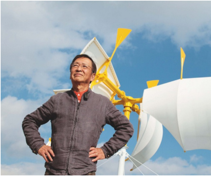
Susumu Shingu devant sa sculpture-éolienne Satomaya, Musée du Vent, Parc Arimanfuji, Sanda, Japon

Susumu Shingu débute comme peintre au Japon puis à Rome dans les années 1960, profondément inspiré par les artistes de la Renaissance comme Léonard de Vinci et son approche mêlant art, science et observation du monde. Sa découverte du mouvement naît presque par hasard, lorsqu'une de ses peintures suspendue à un arbre se met à bouger sous l'effet du vent. Cette expérience fondatrice l'amène progressivement à développer une œuvre sculpturale centrée sur les énergies invisibles de la nature – le vent, l'eau, la lumière ou encore la gravité.