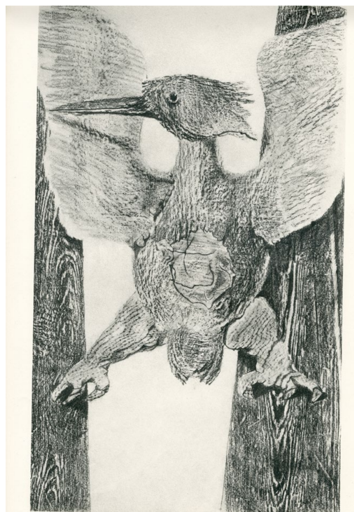
Max Ernst, Histoire Naturelle - L'Origine de la pendule , 1925, Planche XXVI, frottage reproduit en collotype, 50 x 33 cm, édition 191/300, Éditions Jeanne Bucher, photo : Droits réservés, Courtesy Jeanne Bucher Jaeger, Paris-Lisbonne, © Adagp, Paris 2024

« ... Mais que le Mont-Blanc, grâce au prestige de ses 4810 mètres, continue à dominer l'Europe, n'empêche que le rideau du sommeil tombé sur l'ennui du vieux monde, soudain s'est relevé pour des surprises d'astres et de plantes, et s'effondrent les murs entre lesquels on avait voulu enchaîner les vents de l'esprit. Les araignées lasses de manger les mouches se sont repues de nos montagnes habituelles, et nous