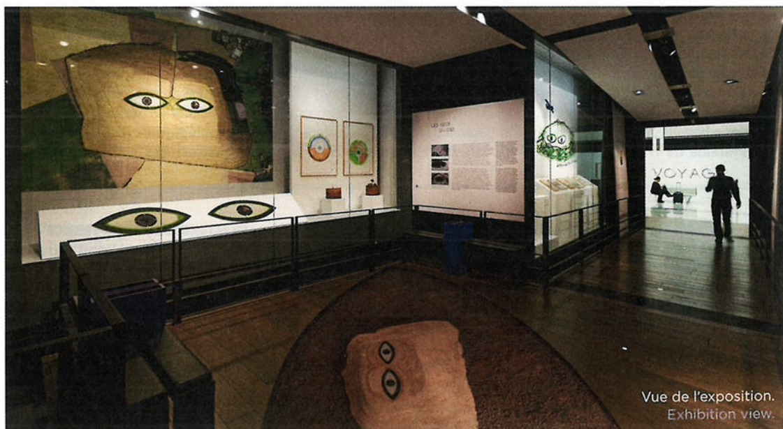
Vue de l'exposition. Exhibition view.

Whether landing or taking off, as they look down from their windows, passengers at Paris-Charles de Gaulle will be surprised to see the 400 x 170 m œil Ouest (West Eye) inaugurated in autumn 2023. Architect and urban planner Antoine Grumbach conceived this work as "Aerial Art". In partnership with Galerie Jeanne Bucher Jaeger, which devoted a major exhibition to the artist from September 2023 to January 2024, the exhibition at Espace Musées revisits the genesis of the project. ◊