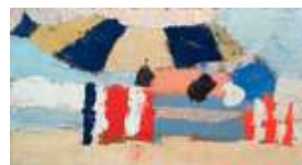
Le Lavandou , 1952 Huile sur carton, 12 × 22 cm Collection particulière