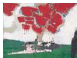
Arbre rouge , 1953 Huile sur toile, 46 × 61 cm Collection particulière