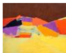
Agrigente , 1954 Huile sur toile, 73 × 92 cm Collection particulière