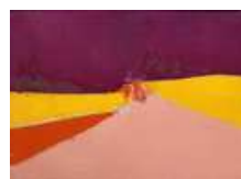
Agrigente , 1954 Huile sur toile, 60 × 81 cm Collection particulière/courtesy Applicat-Prazan, Paris Photo © Annik Wetter