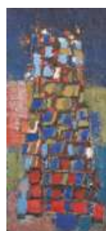
Composition , 1951 Huile sur toile, 157 × 74 cm Collection particulière