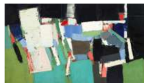
Parc des Princes , 1952 Huile sur toile, 200 × 350 cm Collection particulière