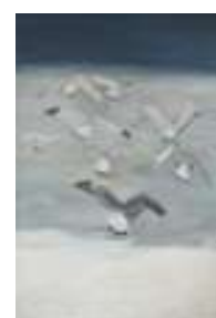
Les Mouettes , 1955 Huile sur toile, 195 × 130 cm Collection particulière