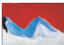
Nu couché bleu , 1955 Huile sur toile, 114 × 162 cm Collection particulière