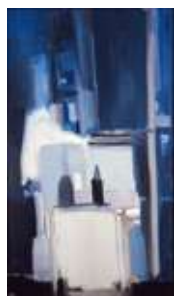
Coin d'atelier fond bleu , 1955 Huile sur toile, 195 × 114 cm Paris, Centre Pompidou, Musée national d'art moderne / Centre de création industrielle Dation, 2014

Ci-dessous, la liste des illustrations réservées exclusivement à la presse dans le cadre de l'exposition. Les images ne doivent en aucun cas être modifiées, coupées, reproduites partiellement ou surimprimées. Les reproductions doivent toujours être accompagnées des légendes, crédits et copyrights.