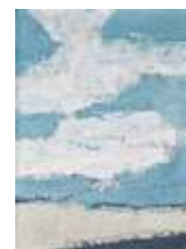
Mer et nuages , 1953 Huile sur toile, 100 × 73 cm Collection particulière