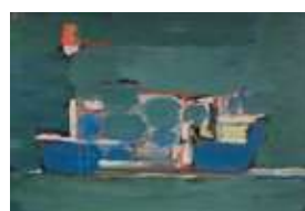
Marine la nuit , 1954 Huile sur toile, 89 × 130 cm Collection particulière