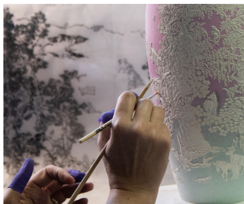
Travail de pâte-sur-pâte sur un vase de Yang Jiechang