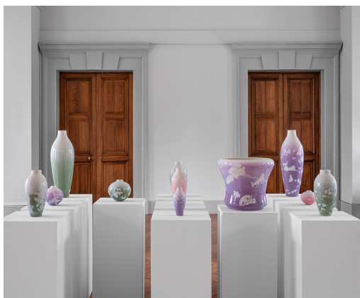
Yang Jiechang, Sèvres, Tale of the 11 th Day , 2021

À Sèvres, Yang Jiechang signe une série de onze vases intitulée Tale of the 11 th Day [Conte du 11 e jour] réalisée par les peintres d'après les dessins de l'artiste. Le titre de l'œuvre fait référence au Décameron de Boccace qui se déroule durant dix jours. Ici l'artiste imagine et raconte l'histoire du onzième jour où les humains et les animaux communiquent, jouent et s'accouplent. Il reprend les codes de la peinture traditionnelle chinoise et met en scène ses personnages dans un paysage paradisiaque, sublimé par les fonds aux couleurs subtiles où tout n'est qu'amour et harmonie.