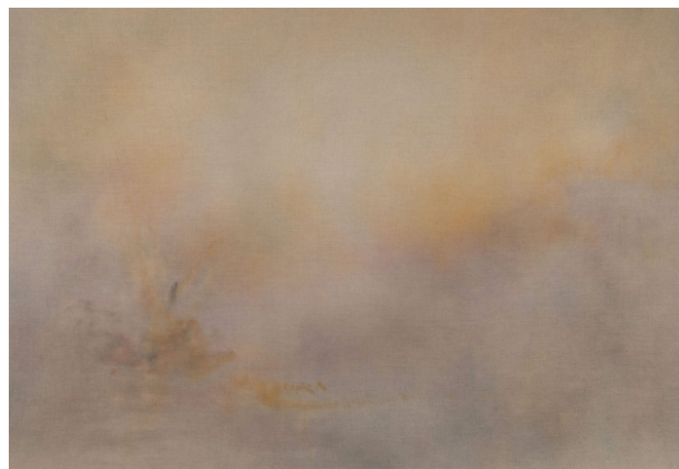
Glider , 2007, Acrylique sur toile 200 x 290 cm

L'exposition SEEING nous invite à pénétrer plus encore au cœur de l'échelle du regard par delà toute temporalité dans l'espace des champs magnétiques de l'acte de voir.