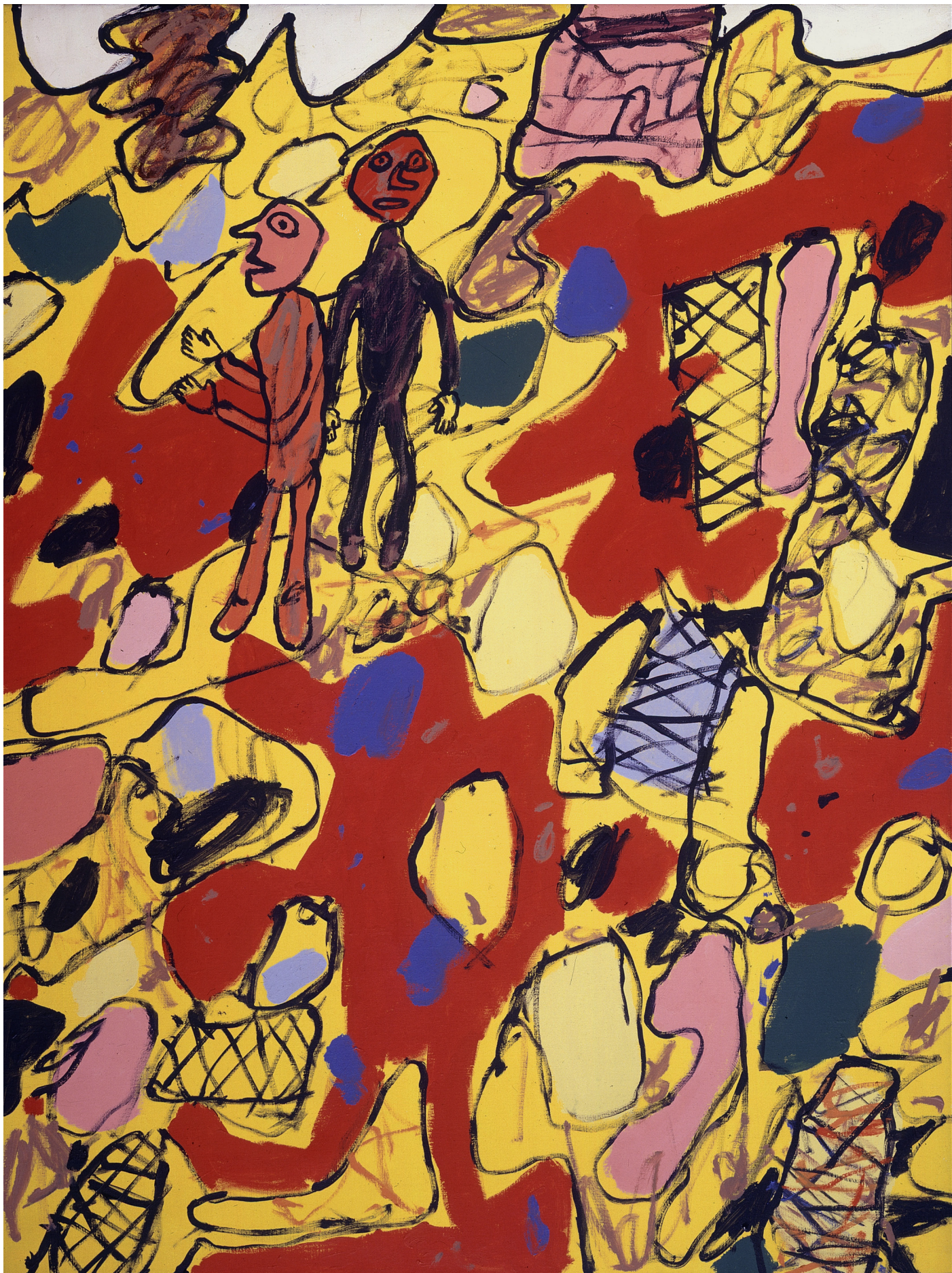
Jean Dubuffet Lieu de campagne aux deux promeneurs , 14 juillet 1975 Acrylique sur toile, 130 x 97 cm Collection Fondation Dubuffet, Paris