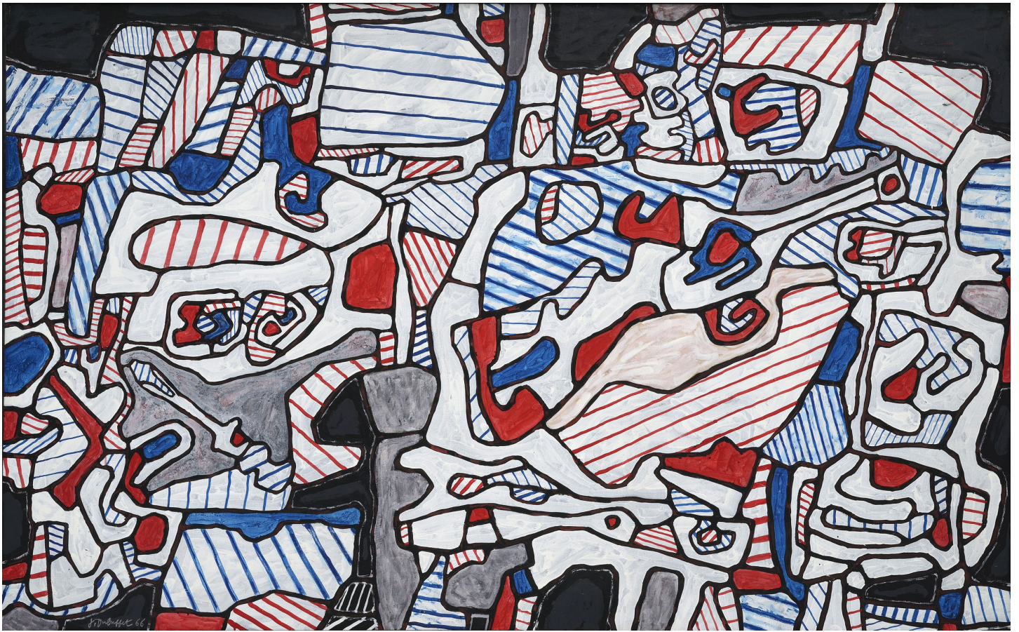
Jean Dubuffet Site domestique (au fusil espadon), avec tête d'Inca et petit fauteuil à droite, 1966 Acrylique sur toile, 125 x 200 cm

Du 17 novembre 2018 au 3 mars 2019, le Palazzo Magnani à Reggio Emilia célèbre Jean Dubuffet (1901-1985), l'un des peintres majeurs du vingtième siècle, inclassable et iconoclaste.