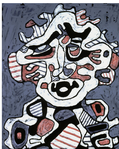
Jean Dubuffet Solario (portrait) , 1er mars 1967 Vinyle sur toile, 100 x 81 cm Collection Fondation Dubuffet, Paris

Après trente ans d'attente, une grande rétrospective est consacrée en Italie à Jean Dubuffet, l'un des artistes les plus originaux et inventifs du vingtième siècle.