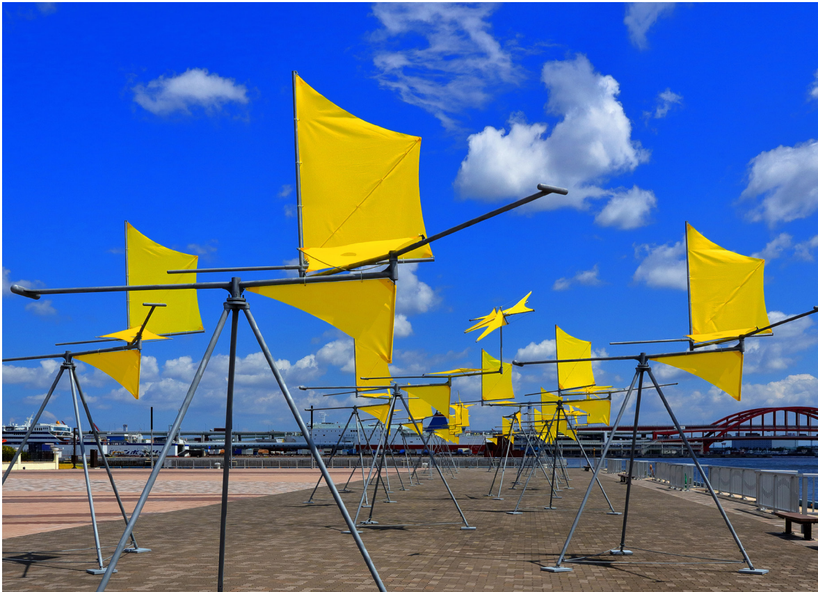
Susumu Shingu, Wind Caravan Kobe , 2017