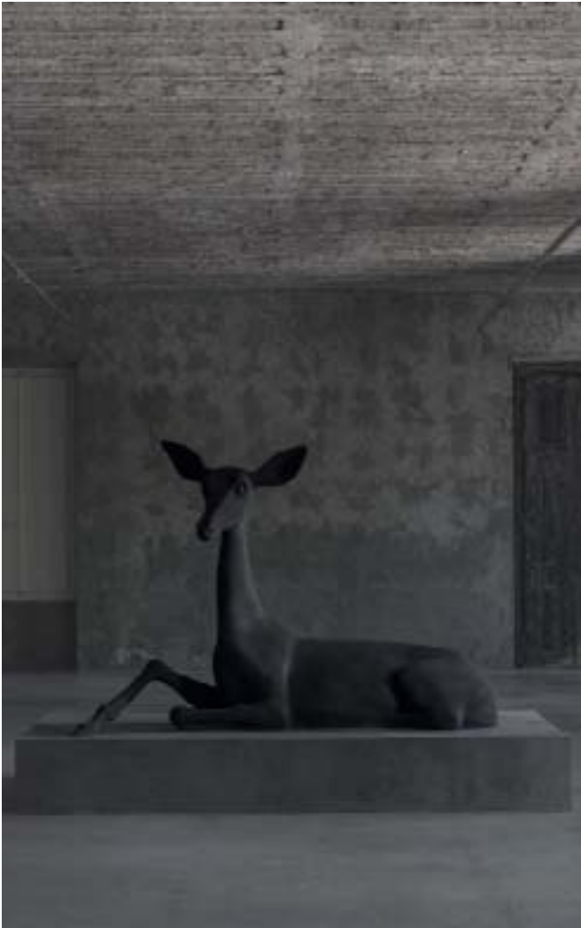
Black Deer , Miguel Branco, 2015 Sala do Veados - National Museum of Natural History, Lisbon, Portugal