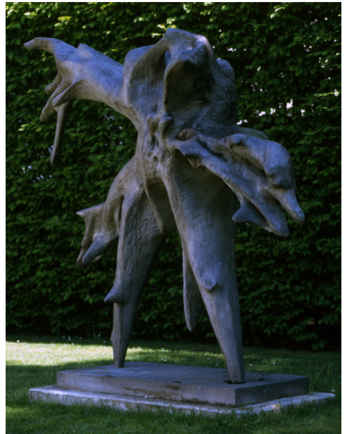
Le grand oiseau, 1960. fonte d'aluminium. 180 x 263 x 70 cm.