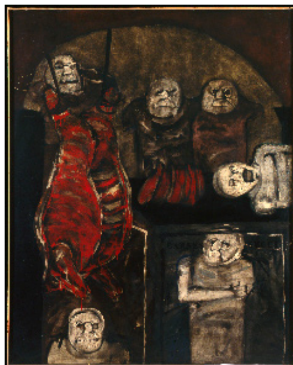
Carnicería, 1963 Huile sur toile 254 x 202 cm / 100 x 79,5 inches