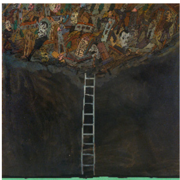
Subí si Podés, 1983 Huile sur toile 200 x 200 cm / 78,7 x 78,7 inches