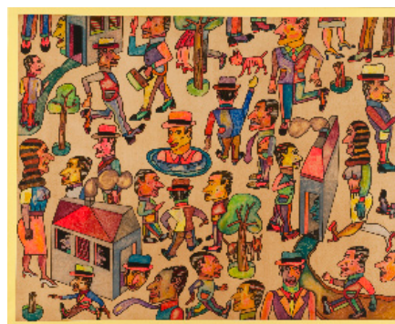
Hombre al Agua, 2009 Acrylique sur toile 81 x 100 cm / 31,8 x 39,3 inches