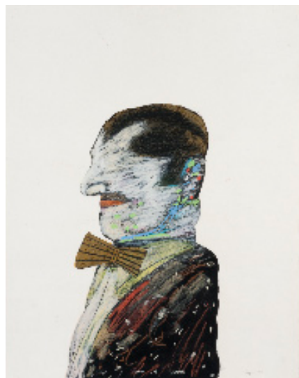
Personnage , 1966 Pastel sur carton 64,9 x 50 cm / 25,5 x 19,6 inches

Seguí compte à son actif plus d'une centaine d'expositions personnelles, il a remporté prix et récompenses sur les cinq continents et enseigné à l'École nationale supérieure des Beaux-Arts. Son œuvre est entrée dans les collections des plus grands musées du monde.