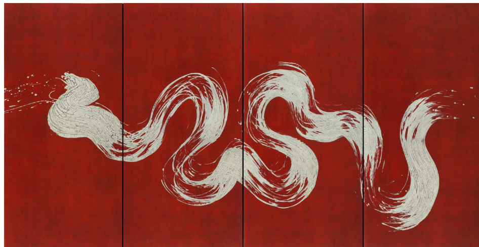
Margareta II. Hommage à Van Eyck. La pensée labyrinthique, 2011 Pigments et encre sur toile © Fabienne Verdier. Courtesy Galerie Jaeger Bucher, Paris.

Après avoir formé son esprit durant dix années à une autre vision du monde tout autant qu'à l'importance de l'intuition par laquelle pénètre l'état d'âme créateur, Fabienne Verdier – depuis son retour en France - n'a eu de cesse d'aller à la rencontre de la peinture occidentale et, plus récemment, de revisiter les grands Maîtres Flamands du XVe siècle. Depuis ses premières œuvres, elle explore les formes gracieuses, abstraites et vitales qu'elle y a décelées. Un des deux espaces de la rue de Saintonge sera dédié à l'étude méticuleuse de la coiffe de Margareta peinte par Van Eyck qui a déclenché chez Fabienne Verdier une véritable constellation d'œuvres nommées La Pensée Labyrinthique ou Méandres .