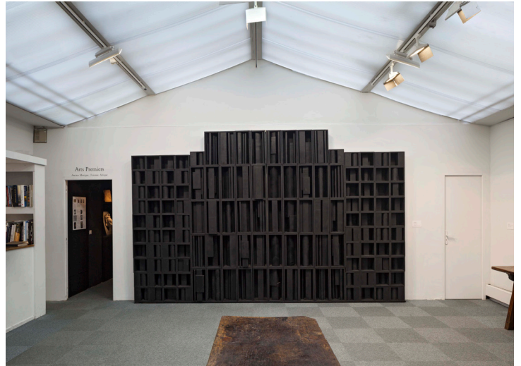
Matière et Mémoire , exposition de groupe, 2013, Galerie Jeanne Bucher Jaeger, rue de Seine

murales qui s'apparentent à des bas-reliefs et dynamisent l'espace. En 1959, elle expose son premier environnement conçu à partir de figures totémiques blanches, Dawn's Wedding Feast (« noces de l'aube »), consacré au thème du mariage, récurrent dans son travail ; en expérimentant de multiples techniques et matériaux, elle poursuivra la réalisation de ses « bibelots-monstres », comme les appelle l'artiste Jean Arp (1886-1966), après avoir découvert Sky Cathedral (1958). En 1966, elle fabrique avec de l'aluminium ses premières sculptures métalliques puis, en 1967, de petites œuvres en plexiglas. Elle répond à des commandes monumentales et crée un des premiers ensembles en acier corten, Atmospheres and Environment X (1969), pour l'université de Princeton, suivi de Night Presence IV (1972) à New York. Figure reconnue de la scène américaine, L. Nevelson est choisie, dès 1962, pour représenter les États-Unis à la Biennale de Venise et, deux ans plus tard, expose à la Documenta de Kassel. Plusieurs rétrospectives lui sont consacrées. En 1979, elle est élue membre de l'American Academy and Institute of Arts and Letters. Le Whitney Museum organise, à l'occasion de son quatre-vingtième anniversaire, l'exposition Atmospheres and Environments . Inclassable, cette artiste, dont les œuvres sont conservées dans les plus grandes collections internationales, joue un rôle majeur dans l'histoire de la sculpture moderne aux États-Unis.