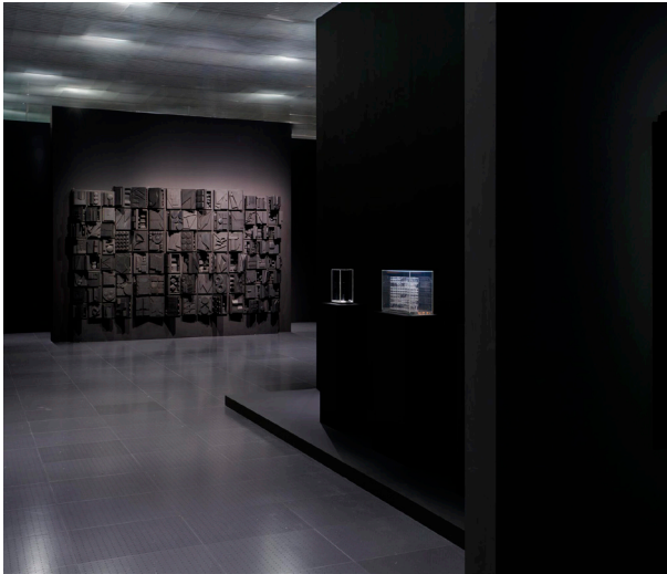
Louise Nevelson. Mrs. N's Palace, 2026. Centre-Pompidou-Metz