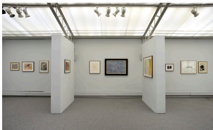
Exposition Tobey - Biberstein, Écritures Contemplatives , Mark Tobey, Michael Biberstein, 2018, Galerie Jeanne Bucher Jaeger, St Germain, Paris