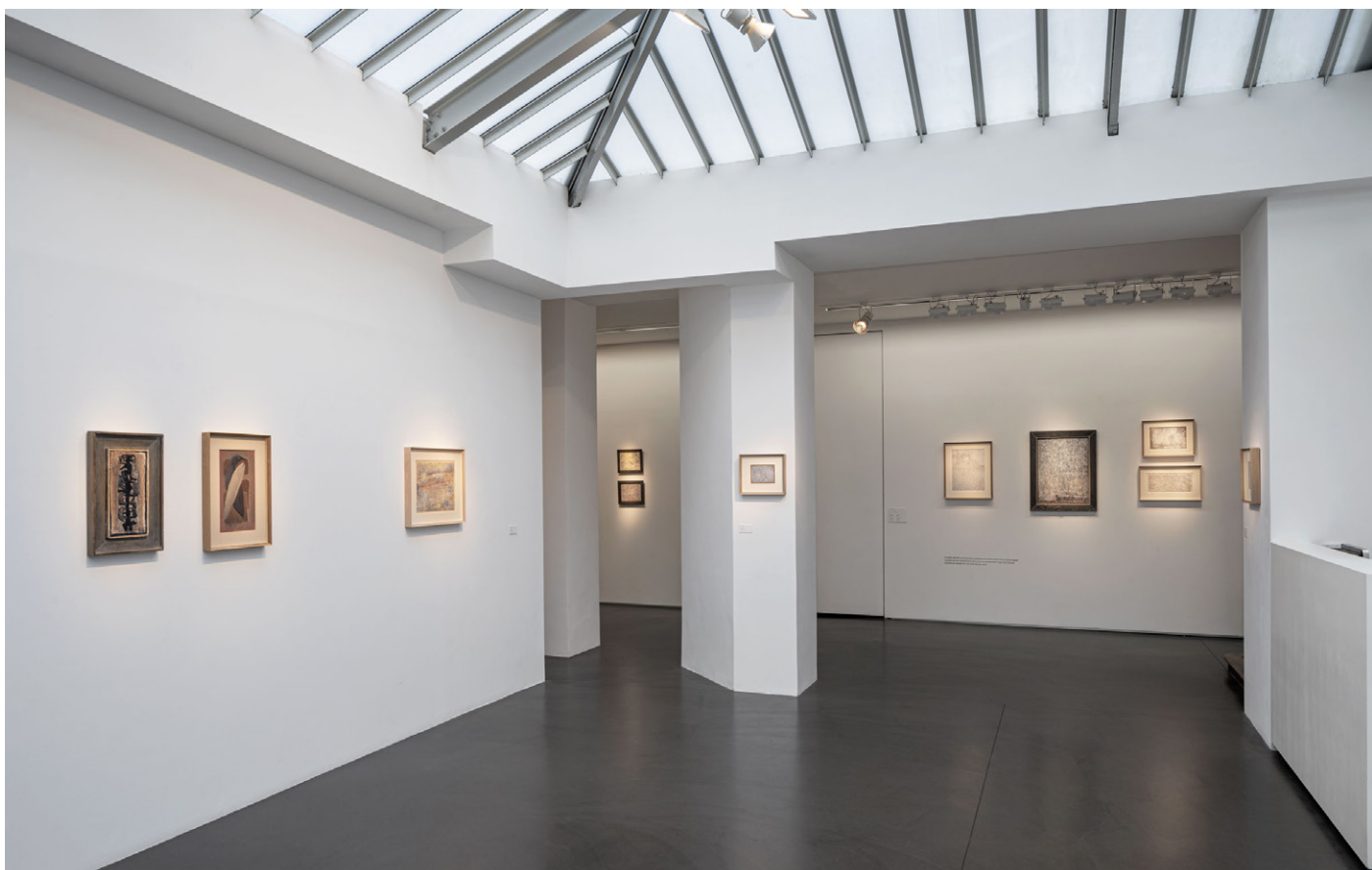
Exposition Tobey or not to be ? , Mark Tobey, 2020, Galerie Jeanne Bucher Jaeger, Marais, Paris

En 2020, la galerie organise une importante exposition monographique rue de Saintonge en collaboration avec le Centre Pompidou et la collection de Beuil – Ract Madoux, accompagnée de la publication d'un catalogue édité chez Gallimard.