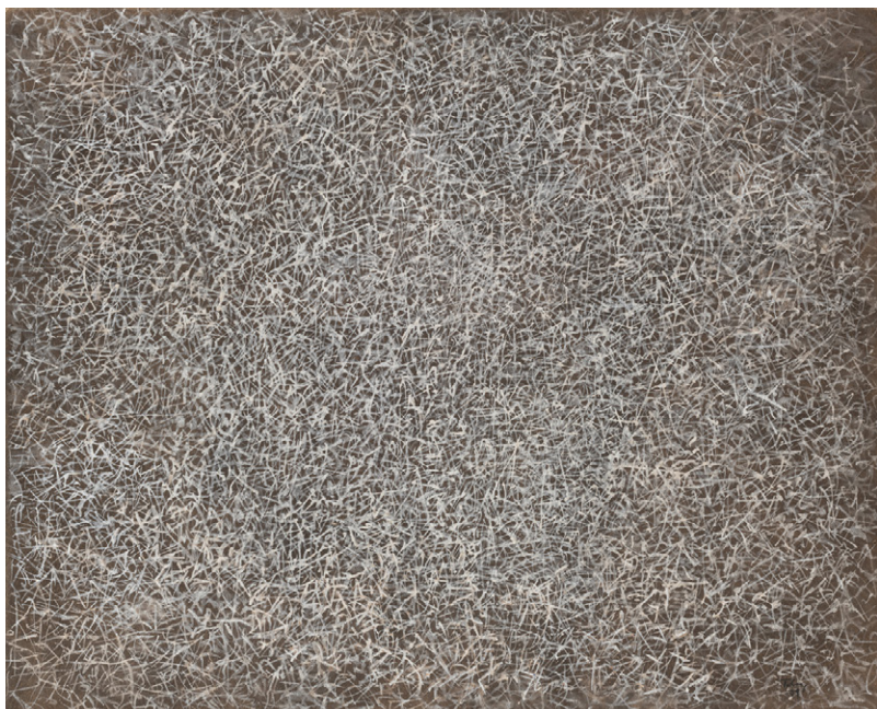
Untitled, 1959 Tempera sur papier 34,6 x 43 cm, encadrée 50 x 48 x 3 cm

Pionnier de l'abstraction américaine, Mark Tobey a eu sa première exposition monographique en Europe à la galerie Jeanne Bucher en 1955. En 1958, il obtiendra le Grand Prix de la Biennale de Venise qui lui ouvrira les portes de la reconnaissance internationale.