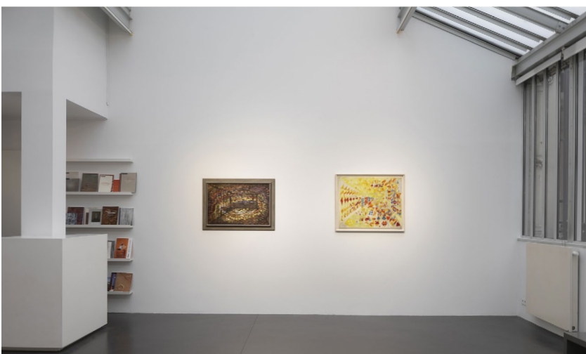
Exposition personnelle Maria Helena Vieira da Silva, 2019, Jeanne Bucher Jaeger - Espace Marais

structure et d'un ordre sous-jacents, Vieira da Silva se plaît à brouiller la frontière entre représentation et abstraction, de sorte que les surfaces évocatrices de pièces, de maisons, de gares connues, de ponts traversant ou de vues urbaines aériennes ne décrivent jamais totalement un seul lieu ou panorama, mais un enchevêtrement de lieux visités. Vieira da Silva peint certainement son étonnement d'être un être vivant, de bouger, de persévérer, de s'ouvrir à la lumière et à l'échange avec tout ce qui l'entoure. Dans la croissance des tissus organiques