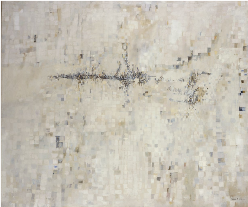
Composition 55, 1955, huile sur toile, 116 x 137 cm

Jeanne Bucher débute en 1933, avec la parution de l'édition Kô & Kô . A cette époque, Vieira da Silva s'intéresse à des perspectives inhabituelles construites autour d'un point de fuite où l'espace joue un rôle primordial. Elle va ensuite le construire par la couleur et les formes en losanges, rappelant les azulejos portugais, créant un réseau structuré « où les personnages se promènent, montent, descendent » dans une maille spatiale. La perspective la passionne, « parvenir à suggérer un espace immense dans un petit morceau de toile » en créant un espace propre. Pendant la Seconde Guerre mondiale, Vieira da Silva et son mari partent au Portugal, puis s'exilent au Brésil, avant de rentrer à Paris en 1947. A son retour, l'Etat français initie une politique d'acquisitions de ses œuvres. Naturalisée française en 1956, Vieira da Silva a reçu de nombreux prix, tant portugais que français, dont le Grand Prix National des Arts en 1966. Elle est ensuite nommée Chevalier de la Légion d'honneur en 1979 et reçoit la Grande Croix de la Liberté au Portugal dans les années 80.