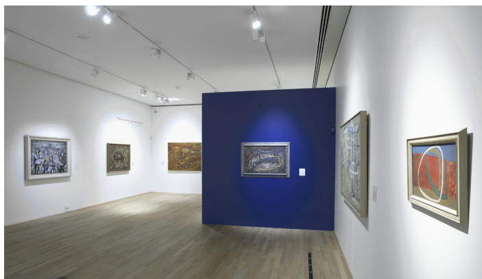
Vue de salles - Exposition Vieira da Silva L'œil du Labyrinthe / L'œil des collectionneurs 2022-2023, Musée des Beaux-Arts de Dijon, France