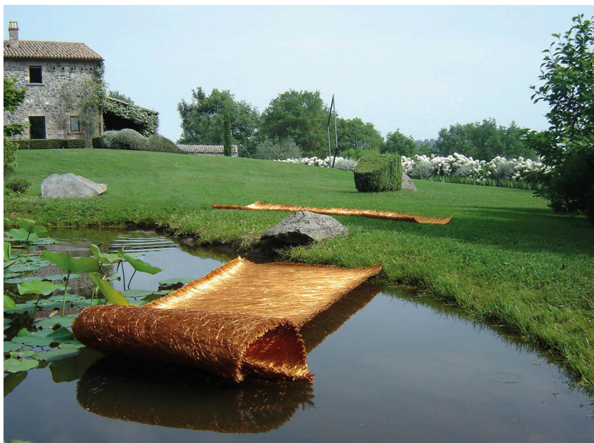
Atelier d'Antonella Zazzera, Italie