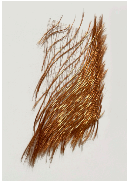
Armonico CDXV, 2023 Fil de cuivre, 87x25x13 cm © Jean-Louis Losi, Courtesy Jeanne Bucher Jaeger, Paris-Lisbonne