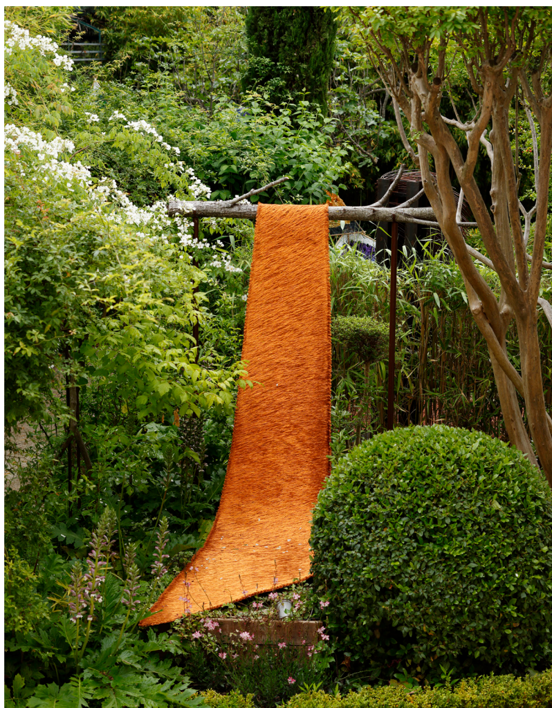
Vue de l'exposition TISSAGE TRESSAGE, 2018, Fondation Villa Datris, L'Isle-sur-la-Sorgue, France