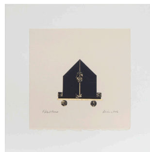
Folded House , 2016 Collage de feuille d'or 22-carat et papier BFK light imprimé avec encre noir monté sur papier Arches 22,8 x 22,8 cm, cadre : 34,01 x 34,01 cm © Jean-Louis Losi, Courtesy Jeanne Bucher Jaeger, Paris-Lisbonne