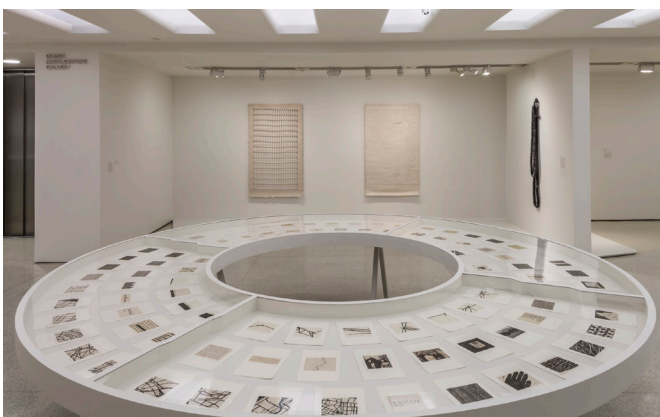
Vue de l'exposition Zarina: Paper Like Skin , 2013, Guggenheim, New York