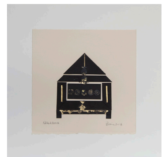
Folded House , 2016 Collage de feuille d'or 22-carat et papier BFK light imprimé avec encre noir monté sur papier Arches 22,8 x 22,8 cm, cadre : 34,01 x 34,01 cm