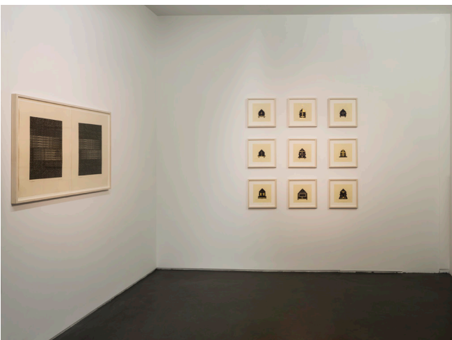
Vue d'exposition Life lines , 2016, Galerie Jeanne Bucher Jaeger, Marais, Paris

Travaillant principalement en taille-douce, en gravure sur bois, en lithographie et en sérigraphie, Zarina a toujours fait de sa vie le sujet de son art. Elle est l'une des rares artistes femme de sa génération à avoir forgé une réelle identité avec ses gravures et sculptures sur le thème de la Partition, de l'exil et la nostalgie de la maison natale. Ses œuvres, essentiellement réalisées de papier gravé, tissé, percé, sculpté, sont les partitions d'une mémoire continue, initiée dans un univers familial intellectuel et cultivé, où l'histoire enseignée par son père ainsi que la littérature et la poésie contribuent au raffinement de son esprit. Son attachement au livre, au mot, à l'Urdu, sa langue maternelle, à la poésie ourdou, essence du soufisme, l'amènent à considérer le papier comme une seconde peau qui respire, vieillit, peut être tâchée, ou encore percée et moulée... Ses études de mathématiques ainsi que sa fascination pour la géométrie pure de l'architecture moghole, avec sa symétrie et son équilibre, sont déterminantes pour son art qui prend la forme d'un parcours initiatique et mystique.