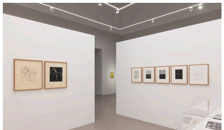
Vue de l'exposition Urdu Worlds , Ishara Art Foundation, 2026