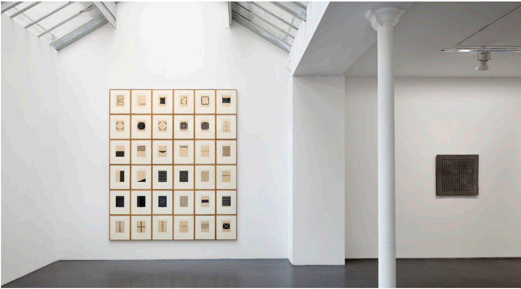
Vue d'exposition Life Lines , 2016, Galerie Jeanne Bucher Jaeger, Marais, Paris

Évocatrices des anciennes tablettes d'écriture, les sculptures en pulpe de papier laissent entrevoir les empreintes de leur temps, nous plongeant dans l'univers fractal de la nature, ou évoquant l'architecture majestueuse des palais islamiques ; sans oublier leurs riches textures et couleurs de pierre que Zarina exprimait à travers les innombrables variétés et mélanges de pigments terracotta, ivoire, rose de Sienne ou encore charbon de bois, graphite et ocre. Parchemin mémoriel, l'œuvre de Zarina est l'expression d'un atlas personnel, de voies multiples et vastes à travers continents et civilisations. Si son travail tend vers le minimalisme, son austérité est tempérée par sa texture et sa matérialité. Son art est une chronique poignante de sa vie et les thèmes récurrents sont la maison, le déplacement, les frontières, le voyage et la mémoire.