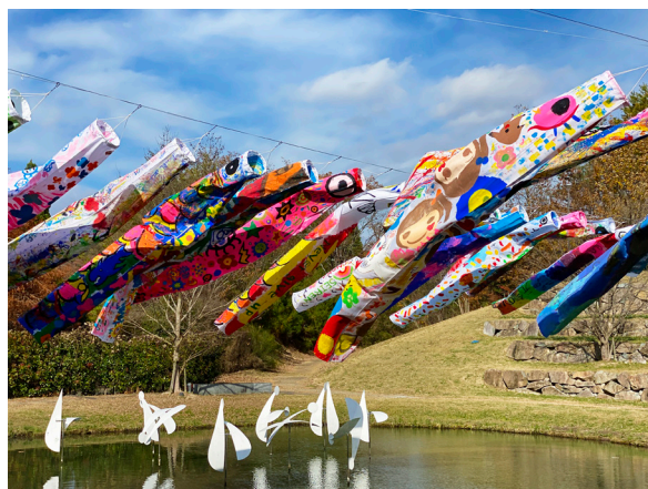
Susumu Shingu, Atelier Genki-nobori , 2 septembre 2023, Arima-fuji Park, Sanda, Hyogo ©Susumu Shingu ©droits réservés

Cette capacité de Susumu Shingu à traduire le vent sous toutes ses formes, en le révélant depuis des décennies dans des sculptures disposées aux 4 coins de la planète, a naturellement conduit l'artiste à présenter ses œuvres en 2019 au Domaine national de Chambord , dans le cadre d'une exposition intitulée Susumu Shingu : une utopie d'aujourd'hui , célébrant les 500 ans de la mort de Leonard de Vinci et les débuts de la construction du Château. À l'image de la Citta ideale du maître italien, l'artiste y exposait en avant-première la maquette de son futur village en construction Atelier Earth , à proximité de son Musée du Vent au Japon, village vivant à partir des énergies naturelles du vent, de l'eau et du soleil, révélant et préservant l'énergie vitale de la nature environnante, un lieu où l'on puisse réfléchir à l'avenir de la Terre, en lien avec les artistes, musiciens, écrivains, universitaires, philosophes, ingénieurs, astronomes et scientifiques du monde entier écrit Shingu.