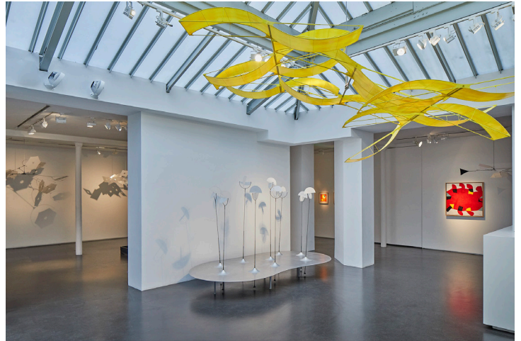
1. Starry Night , 2013, acier inoxydable, aluminium, fibre de carbone, polyester, édition 3/5 H114 x Ø160 cm 2. Exposition Susumu Shingu, Le Souffle d'ici - L'Eau de là , Galerie Jeanne Bucher Jaeger, Paris, Marais, 2024

Débutant sa vocation de peintre au Japon, Susumu Shingu se rend à Rome, au début des années 60, fasciné par l'art de la Renaissance, notamment par Piero della Francesca et Leonard de Vinci, et par la pluridisciplinarité des artistes de l'époque, à la fois peintres, sculpteurs, designers, architectes, paysagistes, ingénieurs, astronomes et scientifiques... Sa tridimensionnalité lui est révélée par hasard : l'effet du vent sur l'une de ses peintures, qu'il suspend à un arbre pour la photographier, la met en mouvement. Ce premier contact avec les énergies invisibles de la Nature – le vent - étoffé plus tard par celui de l'eau, du soleil, de la gravité... est fondamental. Susumu Shingu trouve ainsi, au fil du temps, son plein vocabulaire de sculpteur en approfondissant auprès d'ingénieurs l'aspect scientifique de son travail, l'intelligence du détail des formes, en développant la pratique du mouvement perpétuel dans ses sculptures, qu'elles soient soumises à l'infime souffle intérieur ou aux vents les plus extrêmes en extérieur ; il renoue aussi avec son âme de japonais, empreinte de respect d'une nature absolue, d'acceptation de son imprévisibilité et de contemplation de la beauté de ses formes infinies.