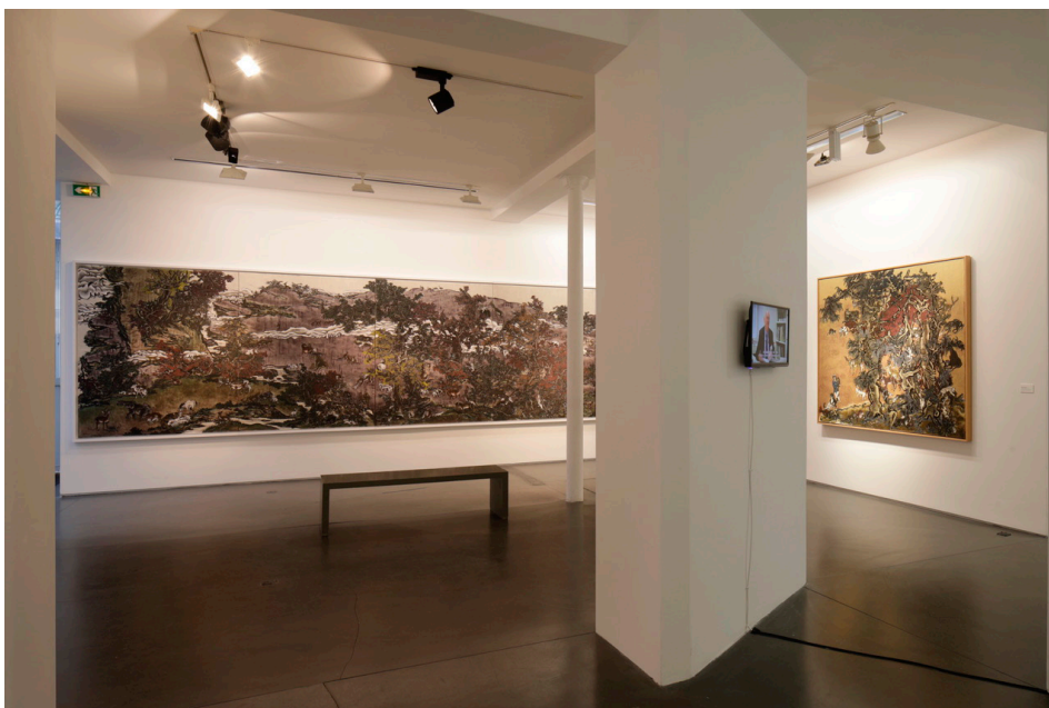
Vue d'exposition Dark Writings , Yang Jiechang, 2019, Galerie Jeanne Bucher Jaeger, Marais, Paris

Invité à la Manufacture de Sèvres, Yang Jiechang collabore cinq ans avec les artisans céramistes de la Manufacture, en réhabilitant la technique de la pâte-sur-pâte, dans une série de onze vases, Tale of the 11th Day , exposée à la Galerie de Sèvres en 2021 , puis au Musée national des arts asiatiques - Guimet qui lui consacra une Carte blanche en 2022.