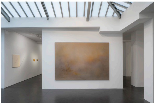
Exposition SEEING , Michael Biberstein, 2020, Galerie Jeanne Bucher Jaeger, Paris