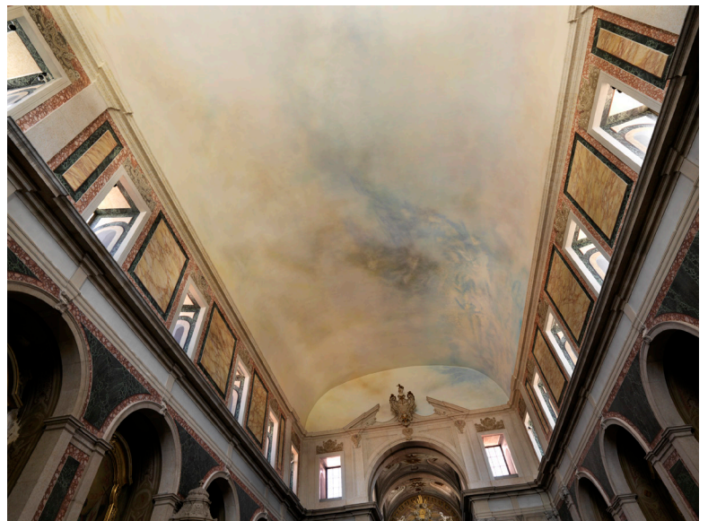
Un Ciel pour Michael Biberstein , Église Santa Isabel, Lisbonne, Portugal, vue du plafond de l'Eglise lors de l'inauguration, 2016