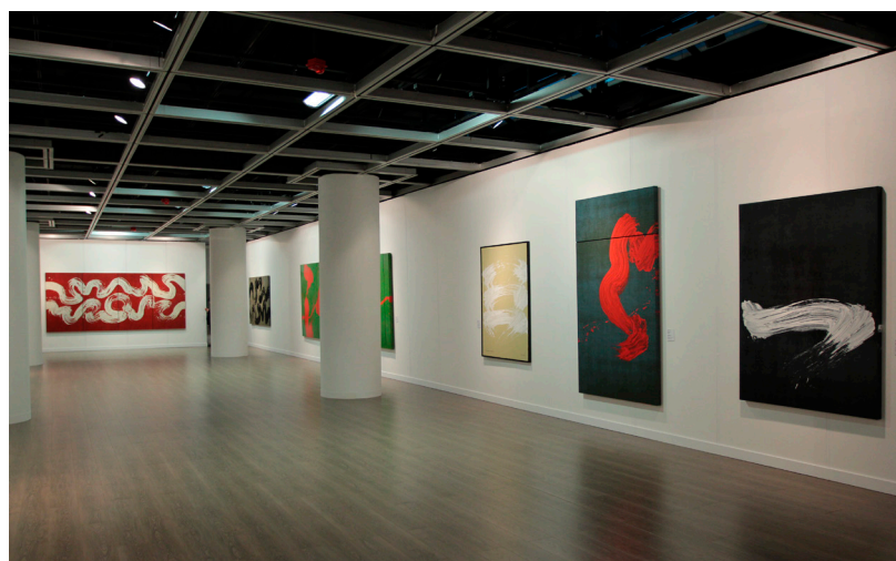
Fabienne Verdier, Crossing Signs , 2014, French May Festival, City Exhibition Hall, Hong-Kong

Après des études à l'Ecole Supérieure des Beaux Arts de Toulouse et un apprentissage de presque dix ans en Chine auprès de grands maîtres chinois (récit conté dans Passagère du Silence ), Fabienne Verdier a développé une forme de peinture éminemment personnelle, intérieure et spirituelle. S'appuyant sur une technique ancestrale pour mieux s'en affranchir, Fabienne Verdier donne à voir une succession de flux inspirés. Sa peinture prolonge les expériences des peintres abstraits américains comme