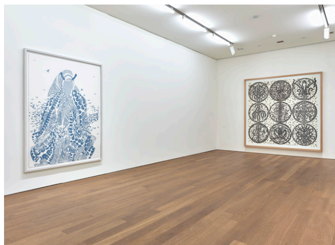
Vue de l'exposition I'm a Lost Giant in a Burnt Forest , Rui Moreira 2014, MUDAM, Luxembourg