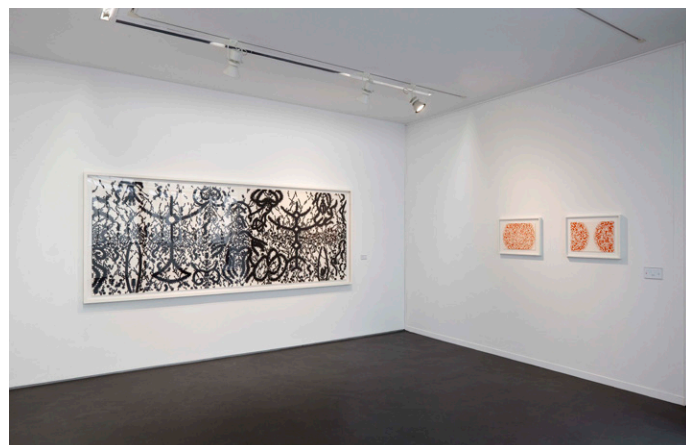
Vue de l'exposition Inner Monsoon , Rui Moreira, 2010, Galerie Jeanne Bucher Jaeger, Marais, Paris