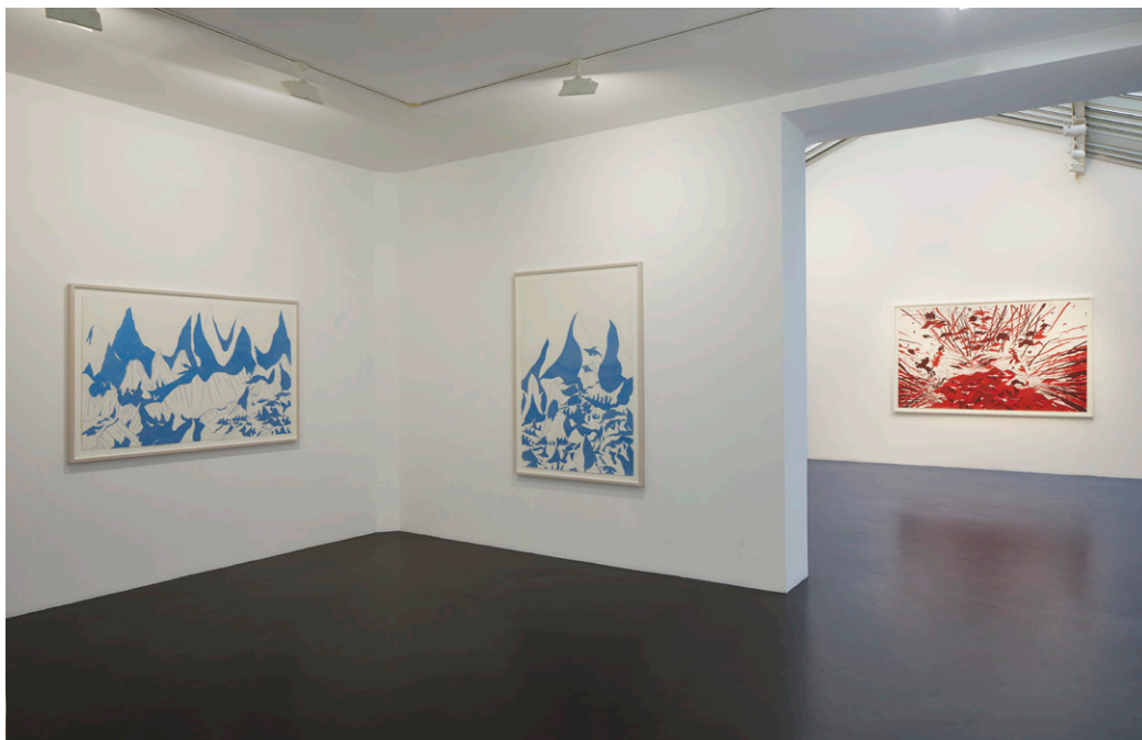
Vue de l'exposition The Passengers , Rui Moreira, 2022, Galerie Jeanne Bucher Jaeger, Marais, Paris

Ses dessins se nourrissent aussi de références cinématographiques telles que Tarkovski, Hitchcock, Herzog, Syberberg ou Kubrick ; de références musicales comme Bach, Stockhausen, de musiques traditionnelles ; ou encore de références artistiques telles les fresques de Piero della Francesca. Sa dernière série de dessins STELLA MARIS se compose de différentes strates, allant du cosmos au monde sous-marin profond. Ces dessins n'existent pas entre deux espaces, mais créent un nouvel espace, un espace-temps cosmique liquide, où le haut et le bas s'épousent, où la dualité s'efface pour ne laisser place qu'à l'Un, où le rythme et le mouvement se font lents, vastes, amples, telle une pulsation universelle. Une pleine lune induit et évoque la fertilité humaine, une éclipse au ralenti suscite un chaos momentané entre humains et animaux, des explosions au cœur de l'astre solaire engendrent révolutions sur la planète Terre... L'amour est le sang de l'univers.