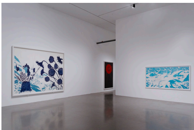
Vues de l'exposition Rui Moreira, Transe , 2025, MAAT, Lisbonne, Photo : Joana Linda, Courtesy of EDP Foundation

Le MAAT - Musée d'Art, Architecture et Technologie à Lisbonne présente une rétrospective majeure de Rui Moreira intitulée Transe du 26 février au 2 juin 2025 en collaboration avec la galerie. Une partie de cette exposition présentée au MAAT est accueillie au Centre d'Art Contemporain Graça Morais à Bragança, du 5 juillet au 14 décembre 2025.